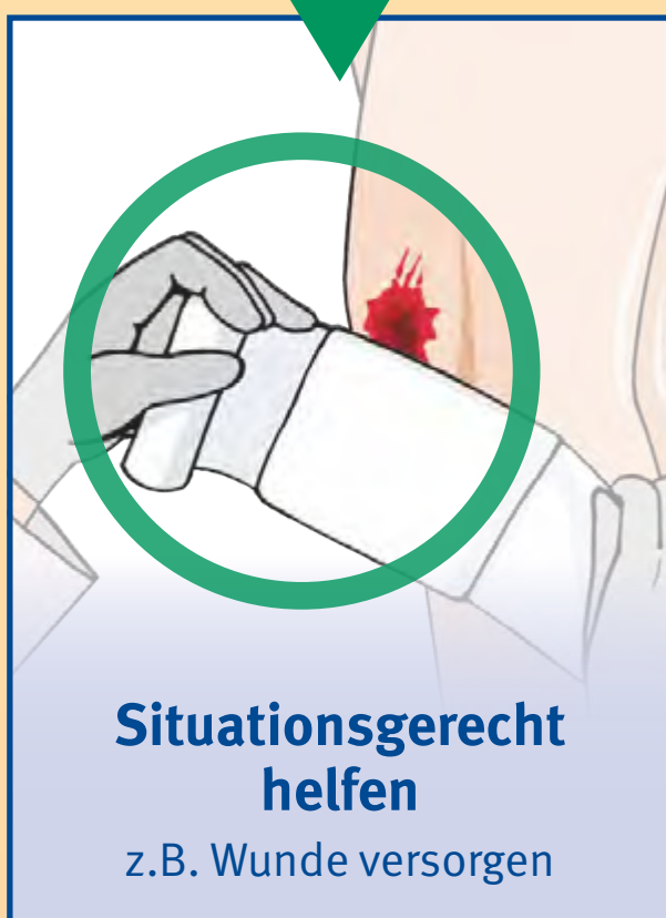
Situationsgerecht helfen z.B. Wunde versorgen