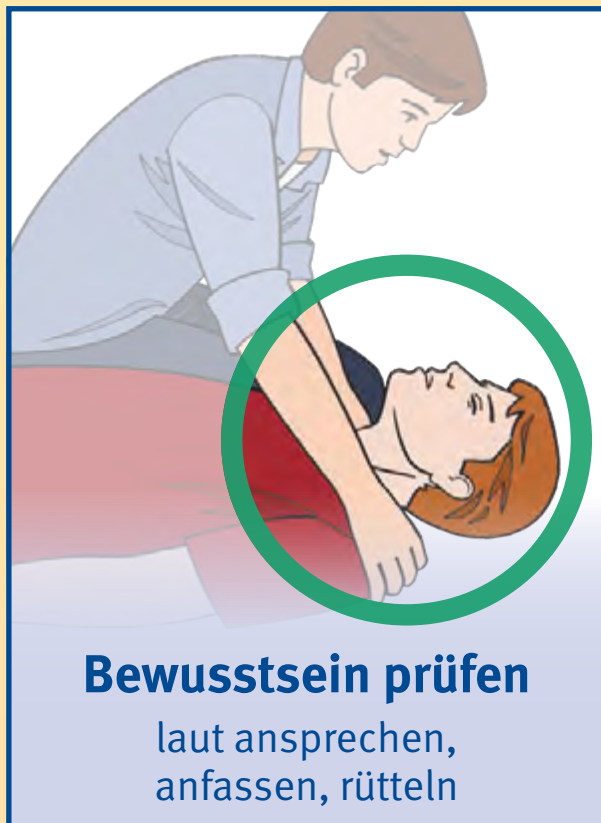
Bewusstsein prüfen laut ansprechen, anfassen, rütteln