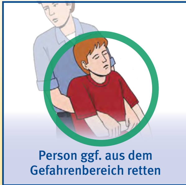
Person ggf. aus dem Gefahrenbereich retten