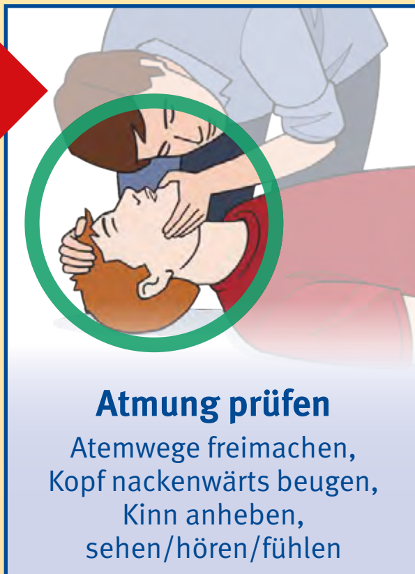
Atemung prüfen Atemwege freimachen, Kopf nackenwärts beugen, Kinn anheben, sehen/hören/fühlen